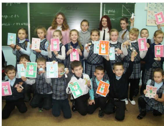
Средняя школа № 8

В средней школе № 8 мы провели полный мастер-класс «Подарок маме», в которой входила и народная кукла и открытка. Нас очень приветливо встречали во всех школах. Спасибо всем ребятам, которые приняли участие в мастер-классах и особое спасибо их учителям. Нас приглашали с новыми мастер-классами и мы уже об этом задумываемся. Девчонки и мальчишки, после нового года мы к вам снова придем, ждите нас!