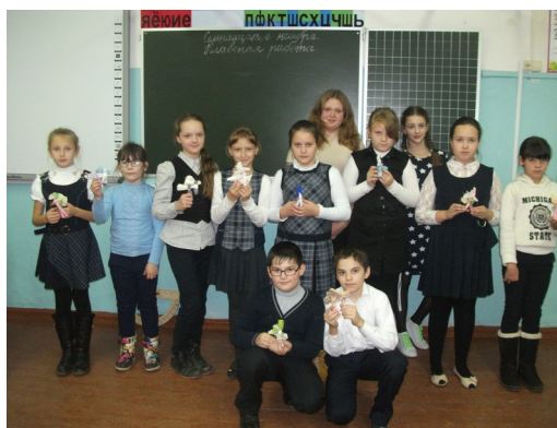
Школа № 11